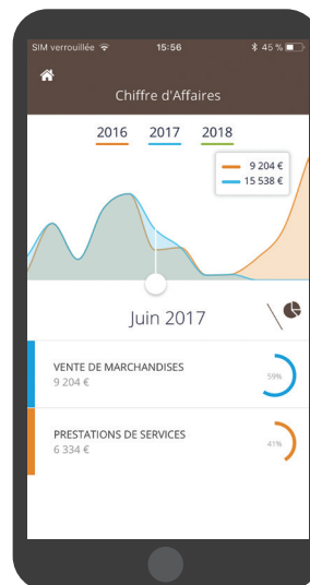
Aperçu en version mobile